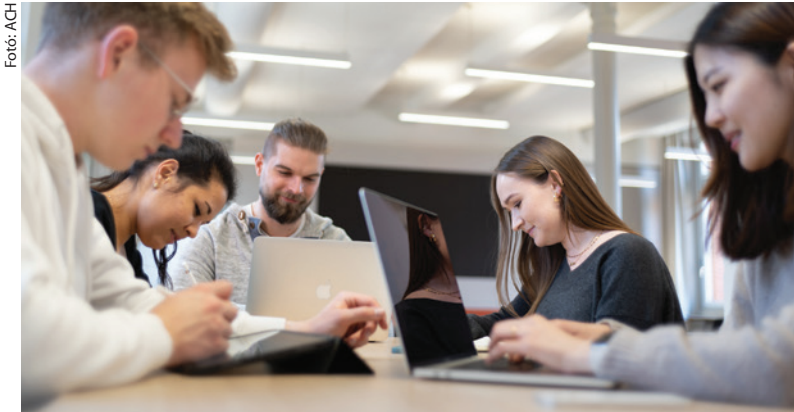
Studierende am ACH, Credits ACH

Die Studiengebühren werden von den jeweiligen Asklepios Kliniken übernommen, die die jungen Absolvent:innen in ihren Häusern anstellen. Mit dem Asklepios Exzellenz Stipendium erklären sich die Studierenden verbindlich nach Abschluss des Diplomstudiums für mindestens vier Jahre an einer Asklepios Klinik tätig zu werden. Bereits während des Studiums werden einzelne Ausbildungsabschnitte, wie Famulaturen und das PJ, in den entsprechenden Häusern absolviert. Zudem unterstützt ein begleitendes Mentoringprogramm den Onboarding-Prozess der Neulinge. Insgesamt werden jährlich fünf Vollzeitstipendien vergeben. Die Laufzeit eines Stipendiums beträgt vier Jahre. Gefördert wird das gesamte klinische Studium vom 5. bis zum 12. Semester in Höhe von insgesamt 65.600,- Euro (16.400,- Euro pro Jahr).