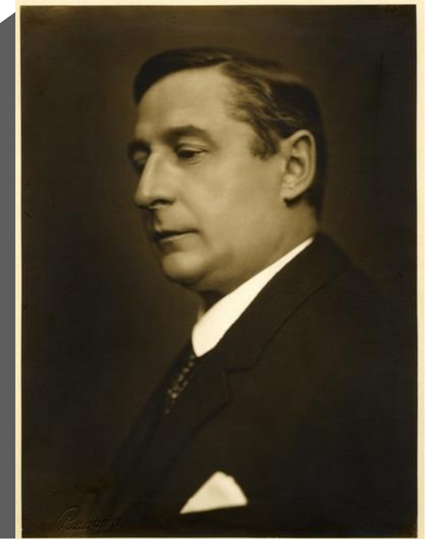
Klebelsberg Kunó, Vallás-, és közoktatásügyi miniszter, 1922

„Ne feledjük el, hogy az a szent terület, amelyet mi hazánknak nevezünk, Közép-Európában, Európa belvárosában fekszik és ha mi magyarok csak egy kisebb műveltségű állam zsúpfedeles házában akarnánk élni, akkor ilyen ház számára nagyon korán túlságosan drágává válnék Európának ebben a belvárosában a házhely! Lebontanák szegény zsúpfedeles házunkat, és más szerencsésebb nemzetek építenének itt modern palotát. Valójában lét vagy nemlét kérdéséről van itt szó.”