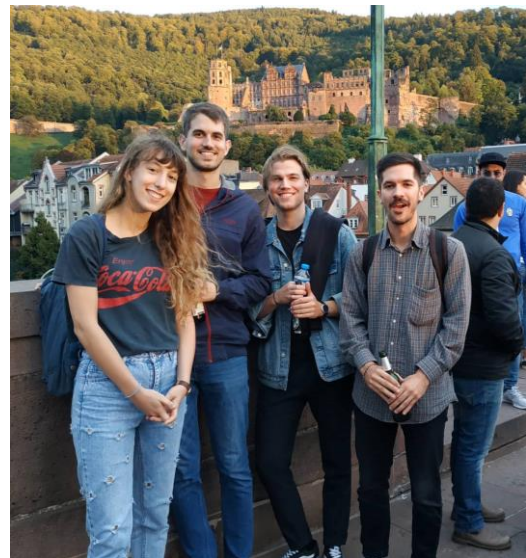
A semmelweises csapat

nos nem indult) Egyrészt a rendszeressége miatt itt lehet igazán jó kapcsolatot kiépíteni másokkal másrészt, ha van a szemeszter végén valamilyen számonkérés, akkor szerintem hatékonyabban tanul az ember. Így jártam tehát a Deutsche Sprachprüfung für den Hochschulzugang (röviden DSH) felkészítő kurzusra. Ez a nyelvvizsga alapvetően egy nyelvi követelmény, ha valaki német nyelven akar egyetem tanulni. Véleményem szerint egy nagyon praktikus tudást adó vizsga és széleskörben elismert. (Itthon DSH-2-től C1 komplexként honosítható.) Szóval szerintem mindenki próbáljon részt venni egy ilyet vagy ehhez hasonló nyelv-