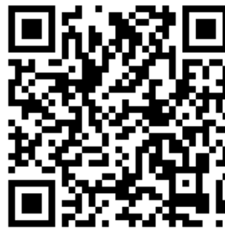
A lapszám zenéinek QR kódja

Még nincs kimondott kedvenc helyem. Talán, amikor a várat újították akkor az egyik kerítésen átmásztam es kiültem a varfalra a Sándor Palota mellett, ahol a köztársasági elnök tanyázik. De azt asszem már nem lehet.