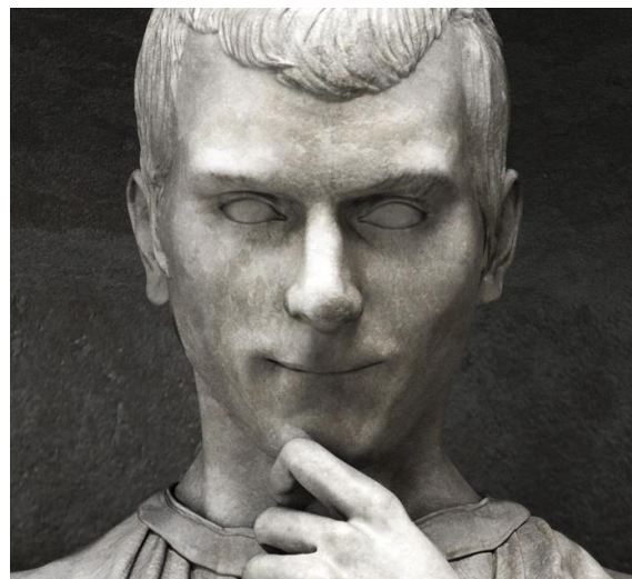
Lorenzo Bartolini: Machiavelli (Firenze)

Kísérleteink során azonban kiderült, hogy a tények nem támasztják alá elvárásainkat. Fiatal felnőttek elmeolvasó képességét egy olyan teszt segítségével mértük, amelyben különböző történeteket kellett megérteniük az