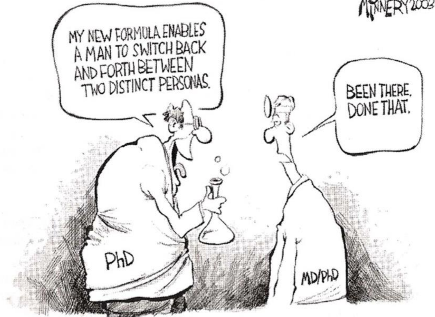
Figure 1.2. Dr. Jekyll/Dr. Hyde. The split personality of the M.D./Ph.D.