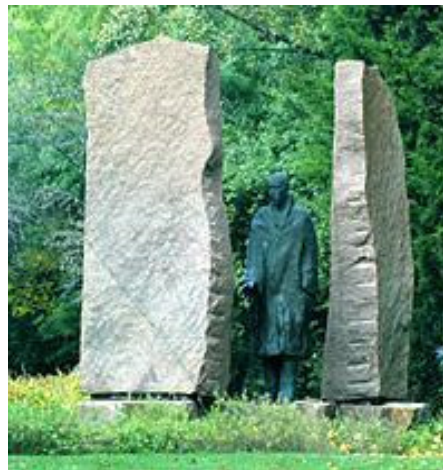
Budapest II. kerület Szilágyi Erzsébet fasor

Pátzay Pál kígyóval küzdő férfit ábrázoló alkotását 1949-ben állították fel első alkalommal. A mű nem sokkal később már Wallenbergre való utalás nélkül bukkant fel Debrecenben. Az eredeti szobor másolatát csak 1999-ben állították fel Budapesten.