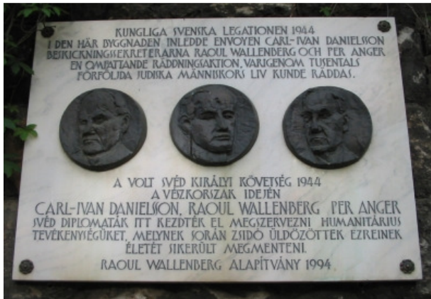
Egykori követségi épület, Budapest XI. kerület Minerva utca 3/b.

Raoul Wallenberg-emléktáblát avattak a budapesti brit nagykövetségénél; a zsidók ezreinek életét megmentő svéd diplomata a második világháború végén itt talált rejtékhelyet munkatársaival együtt.