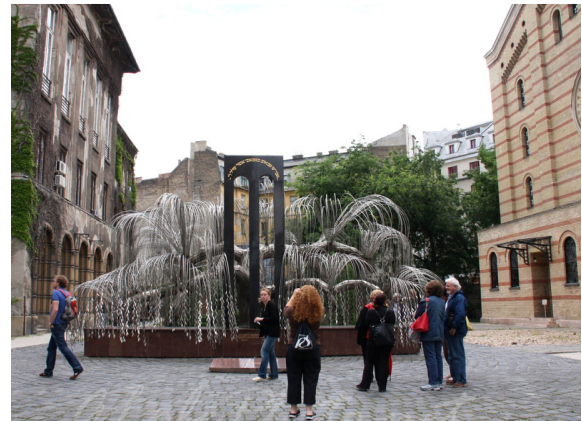
Raoul Wallenberg Emlékpark a Dohány u. Zsinagóga mögött

A Gellért-hegyi épületen emléktábla található. Elhelyezését a Raoul Wallenberg Egyesület kezdeményezte 1994-ben.