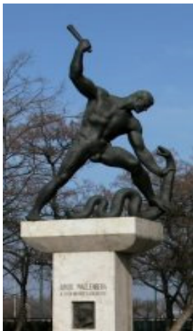
Budapest XIII. kerület Szent István park 27.

Pátzay Pál kígyóval küzdő férfit ábrázoló alkotását 1949-ben állították fel első alkalommal. A mű nem sokkal később már Wallenbergre való utalás nélkül bukkant fel Debrecenben. Az eredeti szobor másolatát csak 1999-ben állították fel Budapesten.