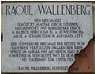
VI. kerület Benczúr u. 16.