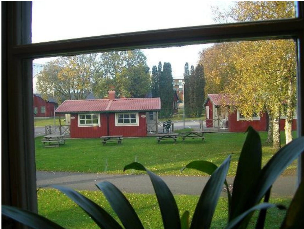
Kilátás a szállásunk ablakából