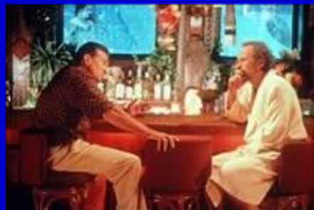
„Analyse That” (Csak semmi pánik) Robert De Niro