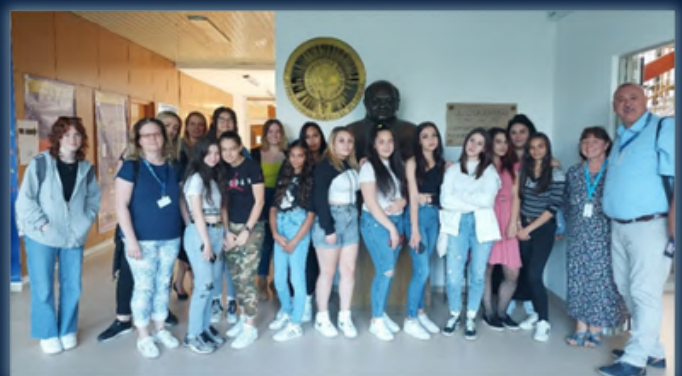
Forrás, kép: SE PAK