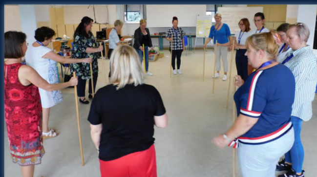
Forrás, kép: SE PAK