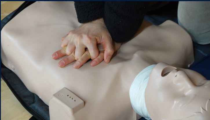
A kép csak illusztráció

2022. december 19. Újraélesztő gyakorlat