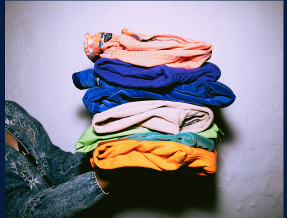
A kép csak illusztráció

A Karácsonyi ruhavásár nagy sikert aratott az SE Pető András Kar dolgozói körében. A Hulladékcsökkentési hét során egyre többen kedvet kaptak, hogy saját jó minőségű, mégis használaton kívüli ruháikat, textíliáikat elhozzák. Jó volt látni, hogy a mások által megunt ruhadarabok egy új gazdánál boldog viselőre találtak. A vásáron befolyt összeget jótékonyági célra került felajánlásra.