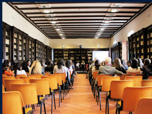
A kép csak illusztráció

Hosszabb szünet (COVID miatt) után örömmel vette a Pedagógiai Intézet, hogy ismét zavartalanul szervezheti a gyermekneurológiai szakvizsgára készülő orvosok gyakorlatát intézményünk gyakorló területein. Egyre nagyobb érdeklődéssel fordulnak a rehabilitációs szakvizsgára készülő orvosok is a konduktív nevelés felnőtt területen megvalósuló konduktív pedagógiai/rehabilitációs ellátás megismerésére.