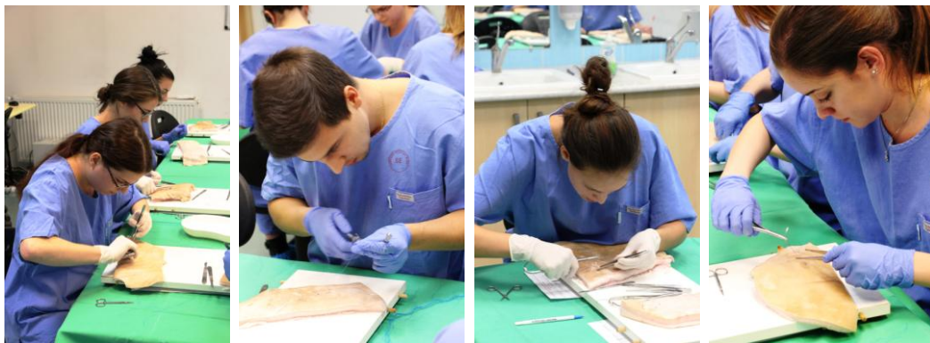
A verseny első fordulója

Az első feladat során a hallgatóknak sertésszöveten V-alakú sebet kellett két vertikális és egy horizontális Allgöwer öltéssel zárnia. A feladtnál 30 pontban maximalizáltuk a varratok minőségét (csücsök helyzete, öltéstávolság, csomó helyzete, öltés feszessége, stb.). A teljesítés idejét mértük, a leggyorsabb hallgató 31, míg a leglassabb 1 pontot kapott. Így összesen 61 pontot lehetett szerezni.