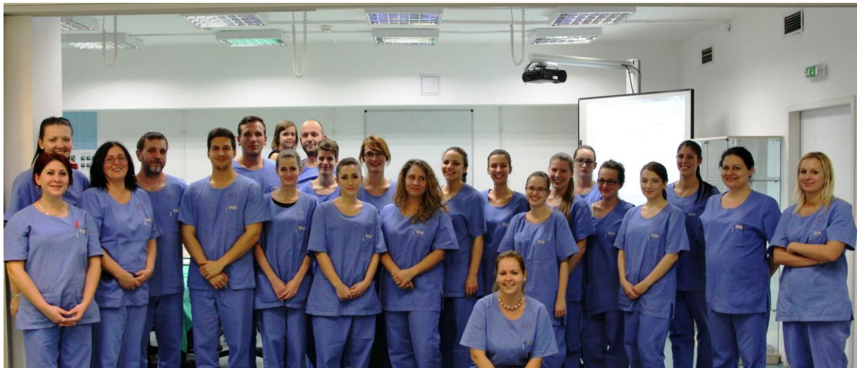
A verseny második fordulójának résztvevői a KSMI munkatársai

Köszönjük a hallgatók kitartását és intézetünk munkatársainak kreatív munkáját.