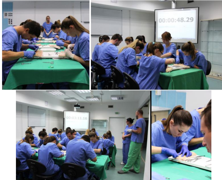
A verseny második fordulója

A második feladat az volt, hogy egy kb. 8-10 cm hosszú metszett sebet kellett Redon drén felett zárni egyszerű tova futó varrattal és a drént horizontális matracvarrattal kellett rögzíteni a bőrhöz.