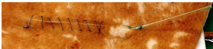
Egy sikeres feladat, ...