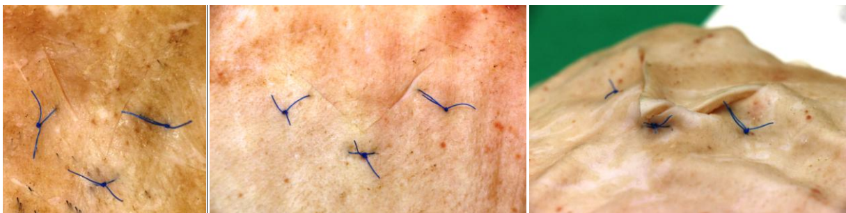
Néhány elkészült jó és helytelen varrat