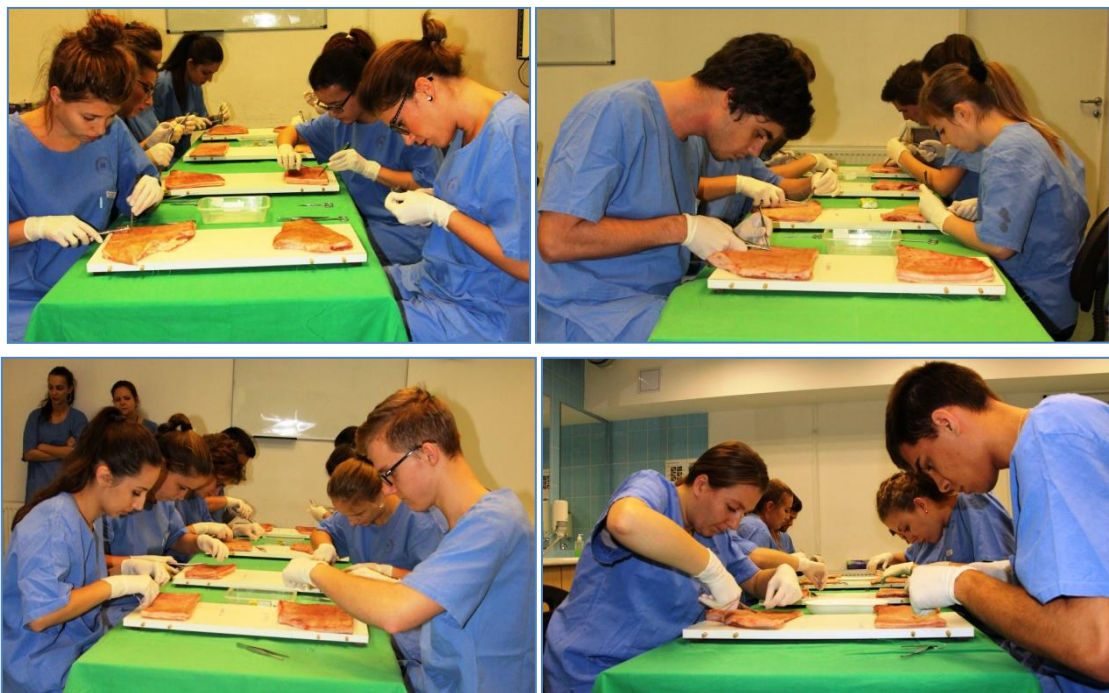
A verseny első fordulója

Az első feladat során a hallgatóknak a már tanult öltésekkel (egyszerű csomós öltés, horizontális matracvarrat, Donati-féle vertikális matracvarrat) kellett egy 10 cm hosszú függőleges sebet bezárni a sertésszöveten. A feladatnál 14 pontban maximalizáltuk a varratok minőségét (öltéstávolság, csomó helyzete, öltés feszessége, stb.). A teljesítés idejét mértük, a leggyorsabb hallgató 32, míg a leglassabb 1 pontot kapott. Így összesen 46 pontot lehetett szerezni.