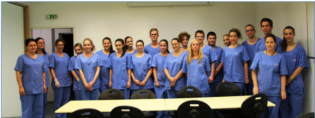
A verseny második fordulójának résztvevői a KSMI munkatársaival és demonstrátoraival

Köszönjük a hallgatók kitartását és intézetünk munkatársainak kreatív munkáját.