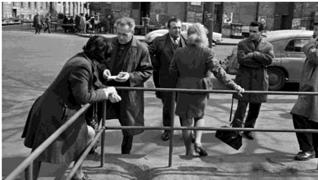
6. ábra a VIII. ker. Rákóczi tér 1990-es évek

nevén a „befektetőként” vagy vezérigazgatóként, aki kicsit szerényebb az gazdasági tanácsadó titullussal érte be.