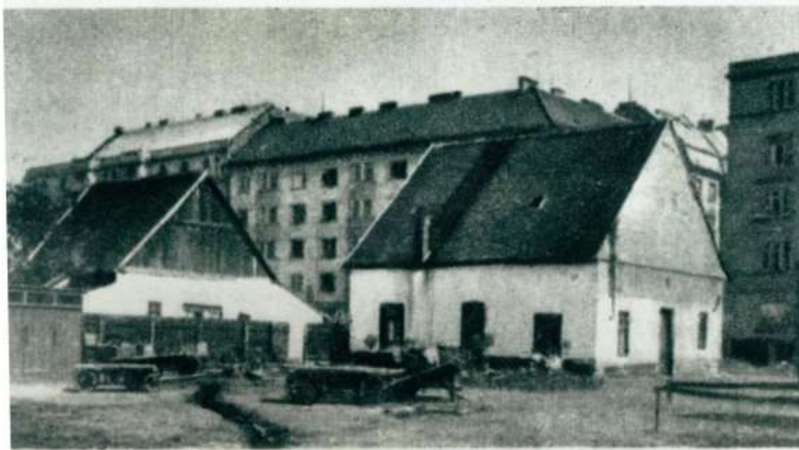
1. ábra Tüköry-féle serfőző.

Különleges és elegáns igazi mulatóhely volt, hogy ne Bécsbe járjanak az urak és a vastagpénztárcájú kereskedők, hanem Pesten költsék el a pénzüket. Ez a mulató, a Neue Welt (Új Világ) 1861-ben készült el, és közel 500 fő befogadására volt alkalmas.