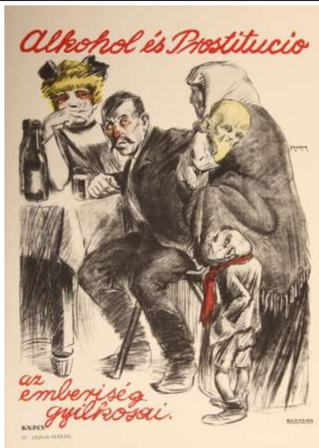
5. ábra A Tanácsköztársaság (1919) egyik híres plakátja, az egészségvédelem és erkölcs védelmében

Így alakult ki a mai József körút, Népszínház utca, Fiúmei-út és Baross utca közti terület a Józsefvárosban, természetesen a Rákóczi térral együtt, ahol az utcai prostituáltak gyűltek össze.