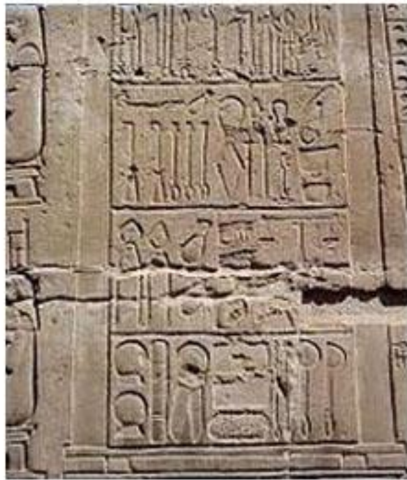
2. ábra Kom Omboban a templom falán sebészeti eszközök ábrázolása látható.

https://hu.wikipedia.org/wiki/Szerkesztő:Ambrus59/Gyógyszerészet_és_gyógyszerkészítés_az_ókori_Egyiptomban