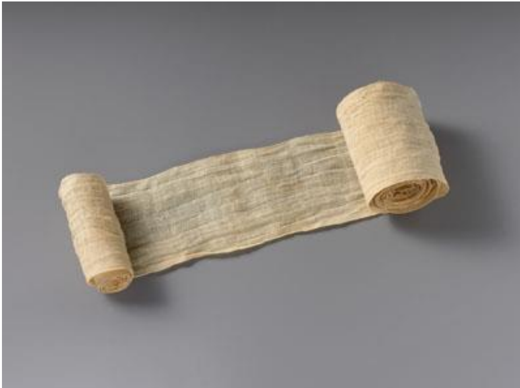
1. ábra Óegyiptomi kötszer. https://www.metmuseum.org/art/collection/search/548838

A kötszerek pamutból voltak és sok esetben mézzel kenték be, hogy ne ragadjon bele a sebbe. A kötözésnél kétféle módszert alkalmaztak a Smith papirusz szerint: