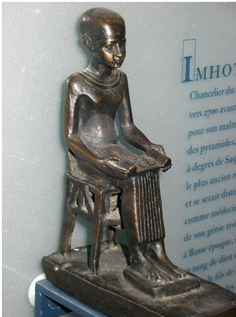
3. ábra Imhotep-szobor a Louvre-ban. https://www.wikiwand.com/hu/Imhotep

Az orvosok egyik legikonikusabb alakja Imhotep 17 (I. e 2600). (3.ábra)