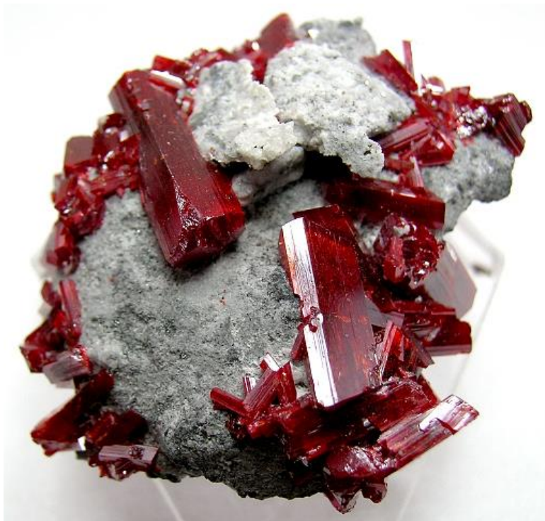
1. ábra: Realgár ( \text{As}_2\text{S}_2 )