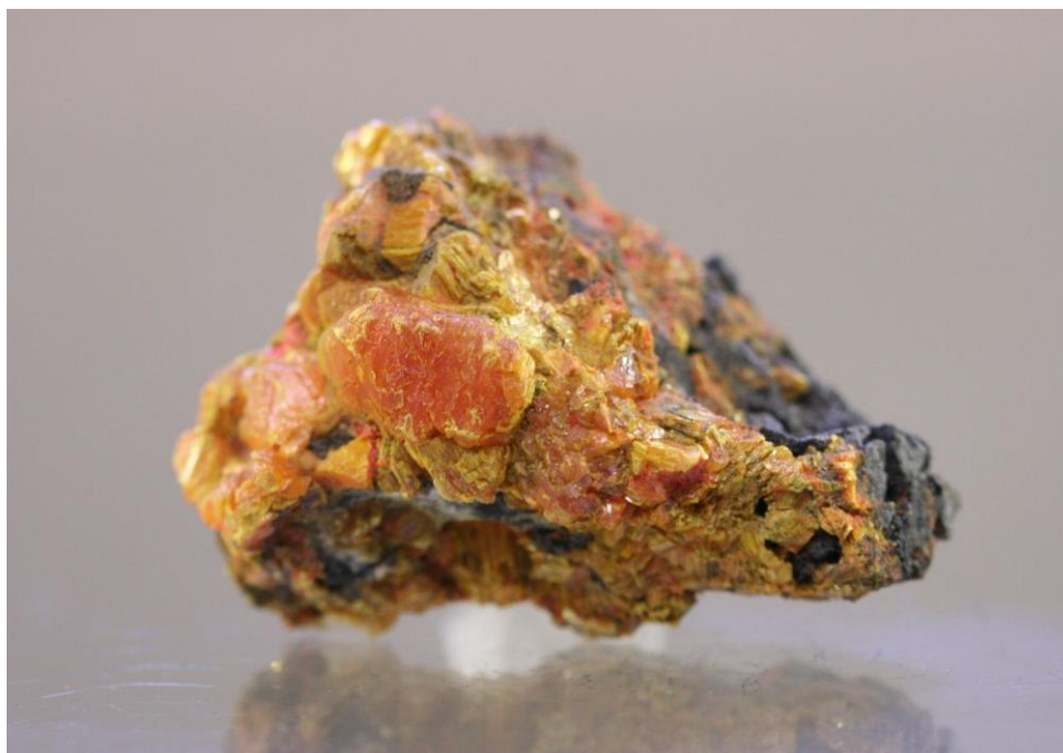
2. ábra: Auripigment ( \text{As}_2\text{S}_3 )