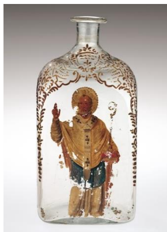
4. ábra: Szent Miklós mannáját tároló üveg

Az egyik leghíresebb, vagy hírhedtebb ilyen eset egy szicíliai nőhöz Giulia Tofana-hoz köthető, aki 17. század első felében élt és dolgozott Dél-Itáliában. Az általa árusított Aqua Tofana egy tiszta, ártalmatlan megjelenésű folyadék volt, amiből négy-hatcseppnyi elegendő volt ahhoz, hogy elpusztítson egy embert. Legfőbb összetevője pedig arzén volt. A hozzá köthető áldozatok száma pedig legalább 600 főre tehető. Megtévesztésként előfordult, hogy egy gyógyító erejűnek tartott olajnak (Szent Miklós mannája) álcázva adták el. [7]