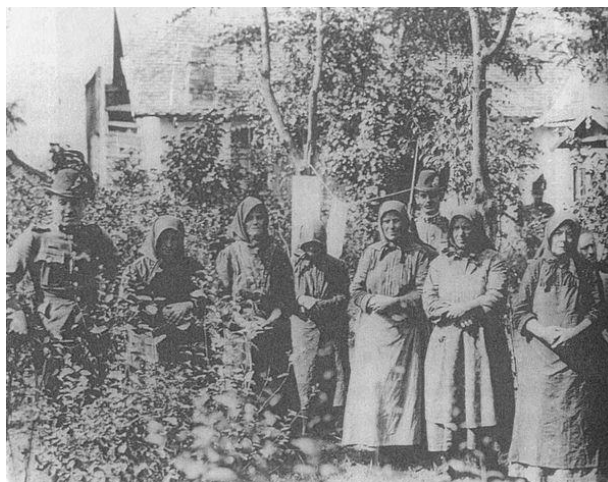
7. ábra: Kihallgatás Nagyréven