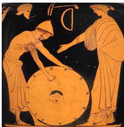
3. ábra: Thetisz páncélt kap fia számára Héphaisztosztól

Bronzkor óta vannak feljegyzések az arzénról, sok helyen az arzén tartalmú ásványokat a réz tartalmú ásványokkal együtt nyerték ki. Így ötvöző anyagként belekerült a rézbe és az aránytól függően eltérő tulajdonságot kölcsönzött az ötvözetnek. A primitív eljárások következtében az arzén a levegőbe került így mérgező a kovácsokat és ezzel degeneratív változásokat okozva nekik. Valószínűsíthető hogy Héphaisztosz a görög mitológia kovácsistene is eme mérgezés nyomait viseli magán. [6]