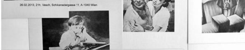
Abbildung: Thematic Apperception Test (TAT), 1935 by Henry Murray & Christiana Morgan, Harvard University Press