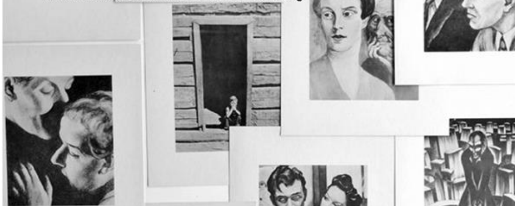
26.02.2013, 21h, Vesch, Schikanedergasse 11, A-1040 Wien