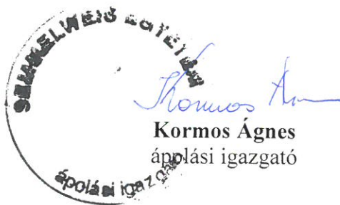
Kormos Ágnes állományi igazgató

Budapest, 2016. 07. 14. ..... Támogatom: