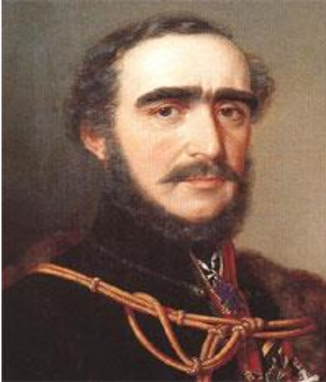
Széchenyi István 1791-1860