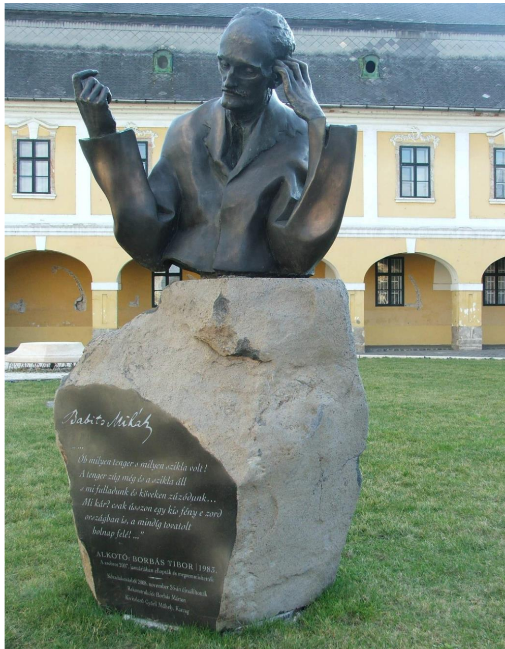
Borbás Tibor: Babits Mihály Esztergom, Széchenyi tér