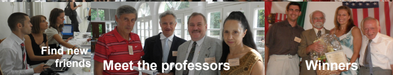
Find new friends