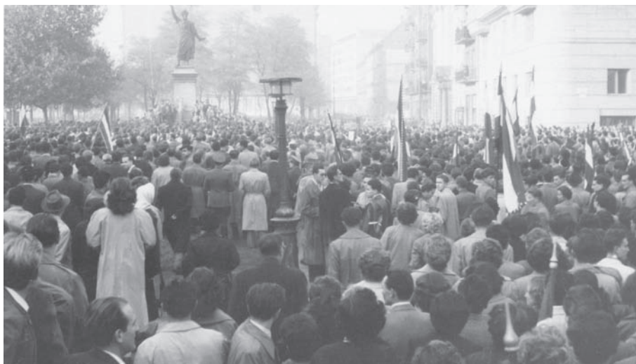
Orvostanhallgatók a tüntetők között 1956 októberében