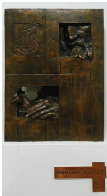
Árkóczy emlékmű az új FOK centrumban