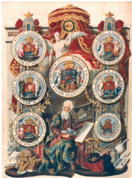
A Diploma Inaugurale 1780