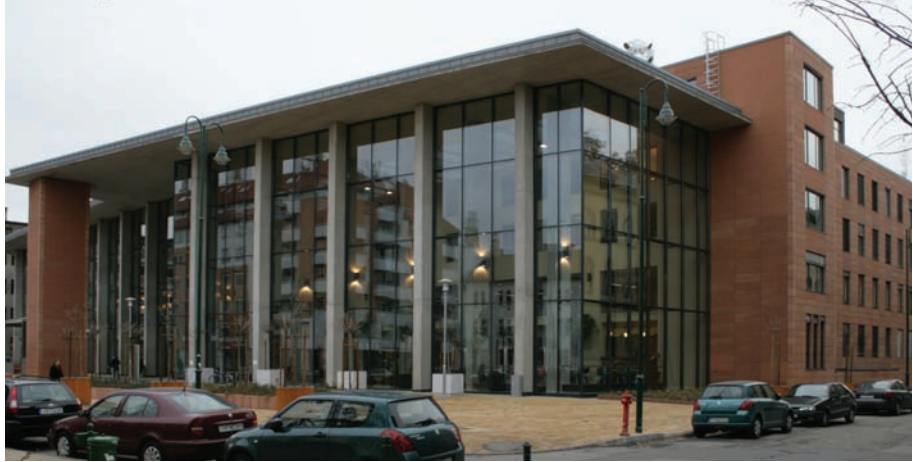
Az új Elméleti Orvostudományi Központ

Szöveg: Molnár László, Központi Levéltár