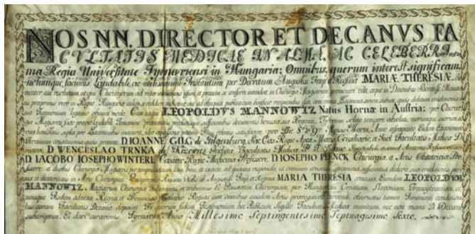
Sebészmeisteri oklevél 1776-ból

lenségét, valamint a liberális tanszabadság elvét. A hallgatók és oktatók jelentős szerepet vállalt a szeptemberben kirobbanó szabadságharcban, részben a honvédseregben vállalt katonai orvosi szolgálattal, részben katonai orvosi tanfolyamok szervezésével, illetve a katonai egészségügy irányításával. A császáriak győzelme utáni megtorlás nem is maradt el.