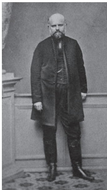
Semmelweis Ignác (1818-1865)

volt az oktatási nyelv. A magyar nyelv 1844-es hivatalossá tétele készületlenül érte az orvosképzést, mivel jószerivel nem létezett még a magyar orvosi műnyelv. Az ezt létrehozó szakmai nyelvújításból a kar oktatói is kivették részüket. Az 1848/49-es forradalom és szabadságharc a pesti egyetem életében is fordulópontot jelentett. Az 1848. évi áprilisi törvénykönyvben külön cikk (1848:XIX.tc.) foglalkozott az egyetemmel, mely végre kimondta annak függet-