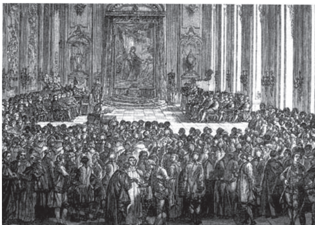
Az egyetem ünnepélyes megnyitása Budán 1780-ben