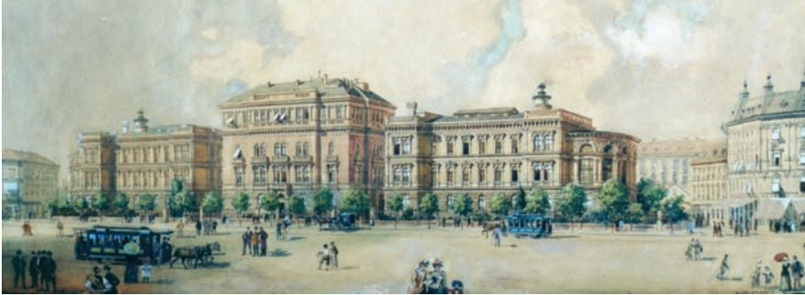
Az Üllői úti Sebészeti Klinika három részből álló főépülete 1884-ben – Mirkovszky Géza korabeli akvarelljén

kiépítésének, és az azt kiszolgáló felsőoktatásnak a fejlesztési terve adott választ. 1872-ben, összevonva az orvosdoktori és sebészmeszteri szakokat, bevezették az egységes orvosképzést, megalapították az orvostudományegyetemet Kolozsvárott, majd 1873-tól megindulhatott a pesti orvoskar vadonutjai telepeinek kiépítése. Az 1911-ig tartó építkezések igen jelentős összeget, mintegy 25 millió koronát emésztettek fel, eredményeként pedig