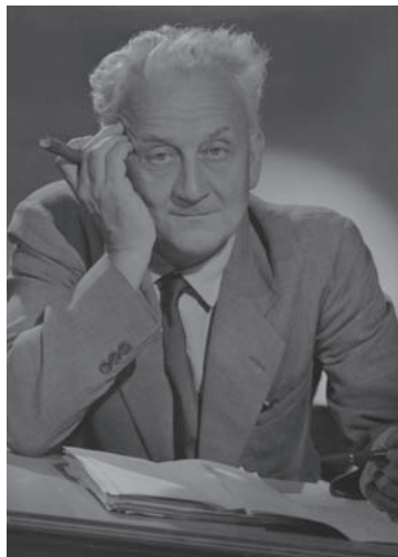
Szent-Györgyi Albert (1893–1986)