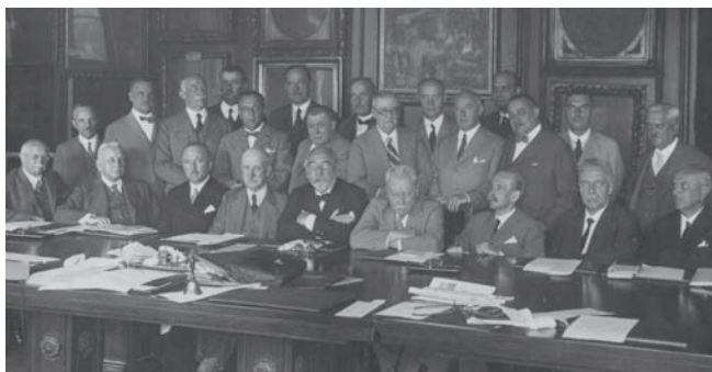
A tanártestület 1935-ben