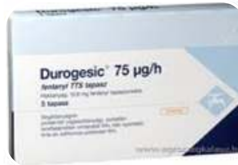
Durogesic® tapasz (fentanil)