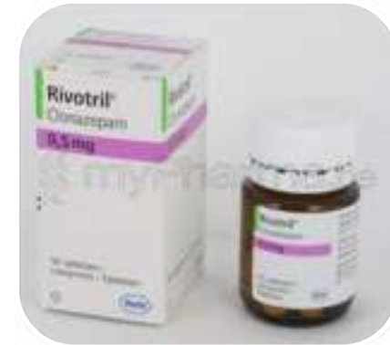
Rivotril® tabl. (klonazepám)