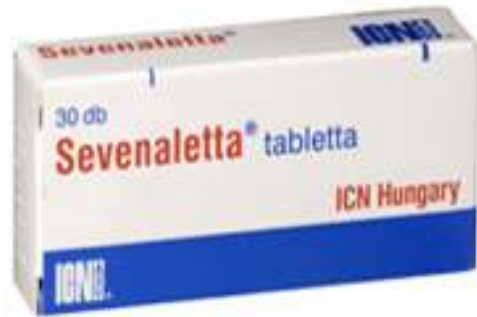
Sevenaletta® tabl. (phenobarbital)

Melyek tartoznak a fokozottan ellenőrzött készítmények közé?