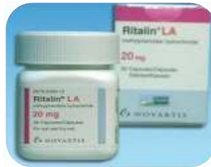
Ritalin® kapsz. (metilfenidát)