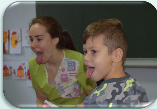
2 csoport, 8+8 hét