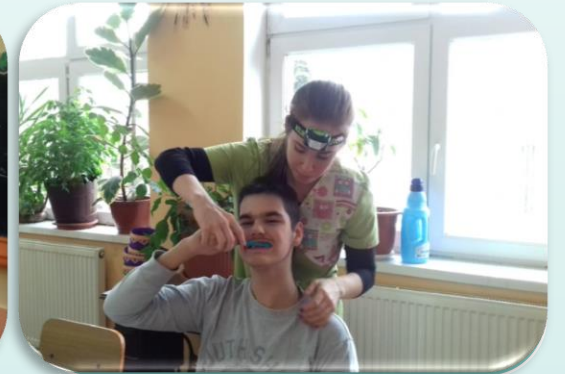
Gyakori ismétlés ( tell-show-do)