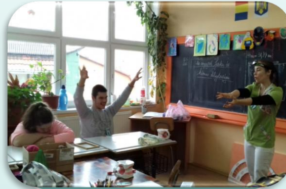
Tagoltság : osztályterem és fogorvosi rendelő