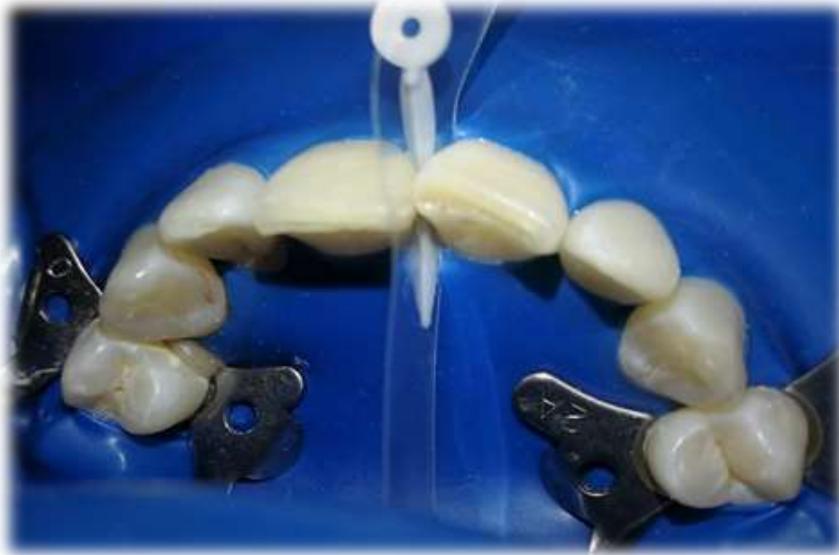
Kofferdám, matrica, ék in situ