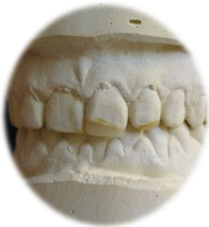
diagnosztikus felviaszolás (wax-up)