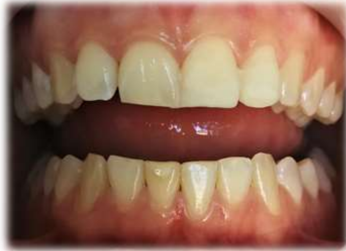
Diagnosztikus mintázat (mock-up)