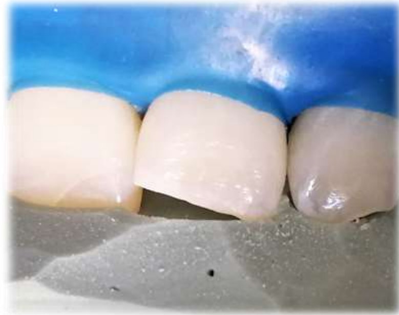
Szilikon sablon használata