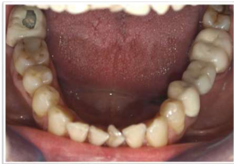
A felső és az alsó fogív