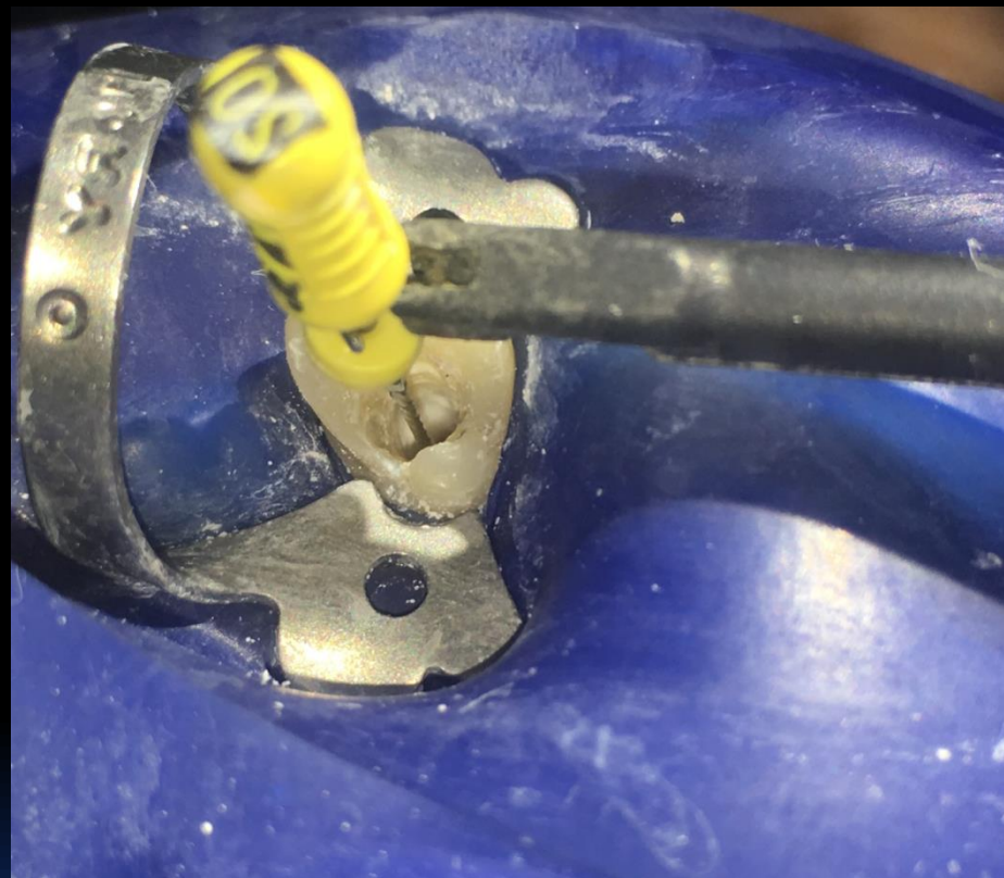
Járulékos csatorna: 22mm