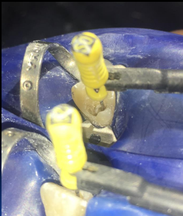
főcsatorna: 23,5 mm