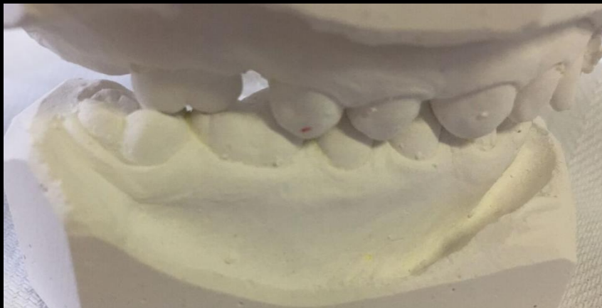
Jobb oldal: Angle I., 17-es fog mesialis angulációja