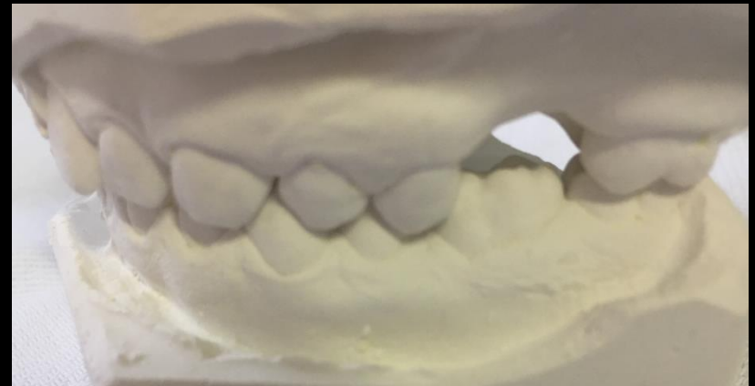
Bal oldal: Angle I.