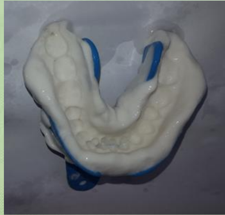
Felső, alsó alginát lenyomat