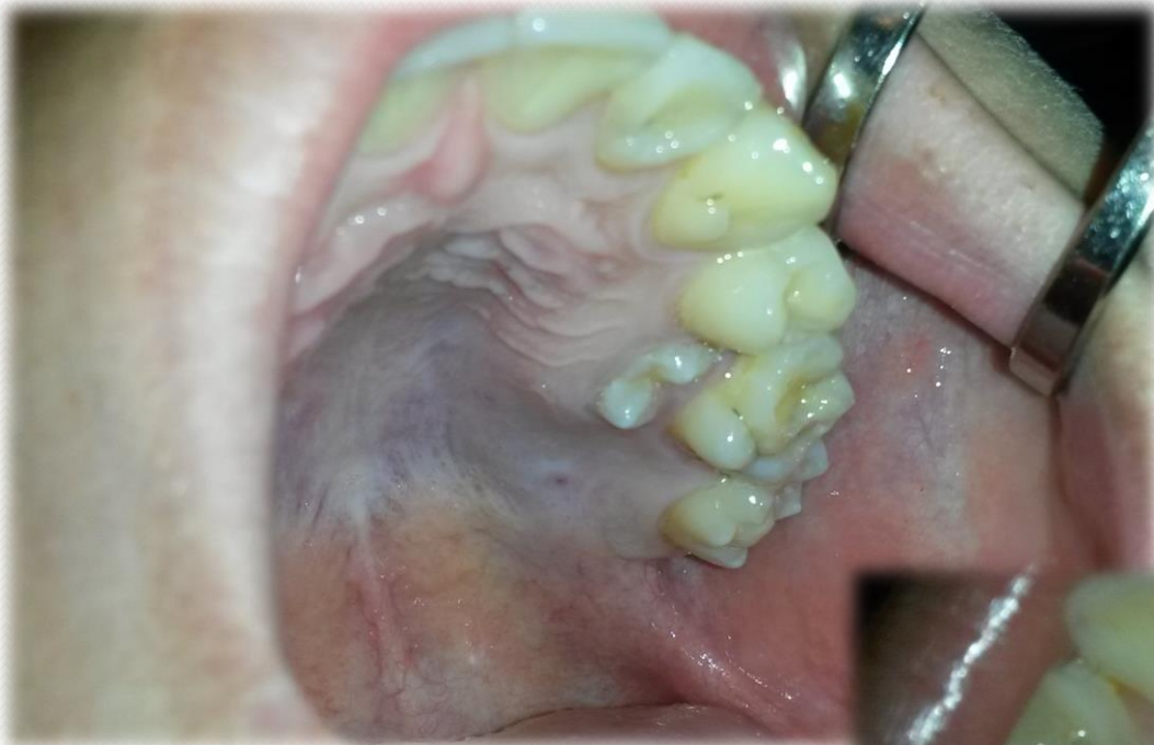
Intraoralis kiindulási kép