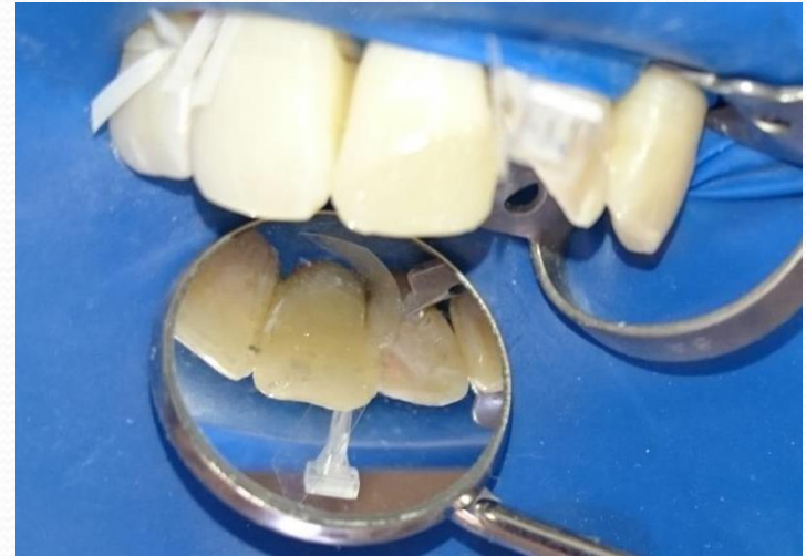
21, 22-es fogak finírozás, polírozás előtt