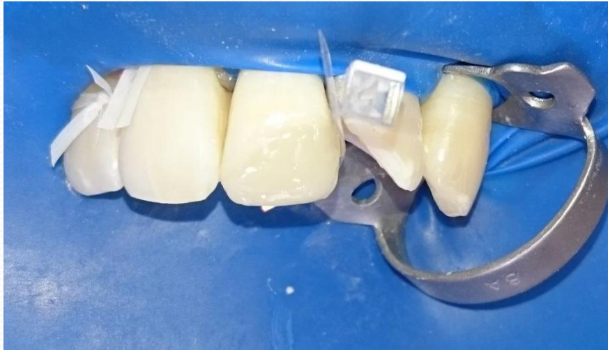
22-es fog matrica ék in situ