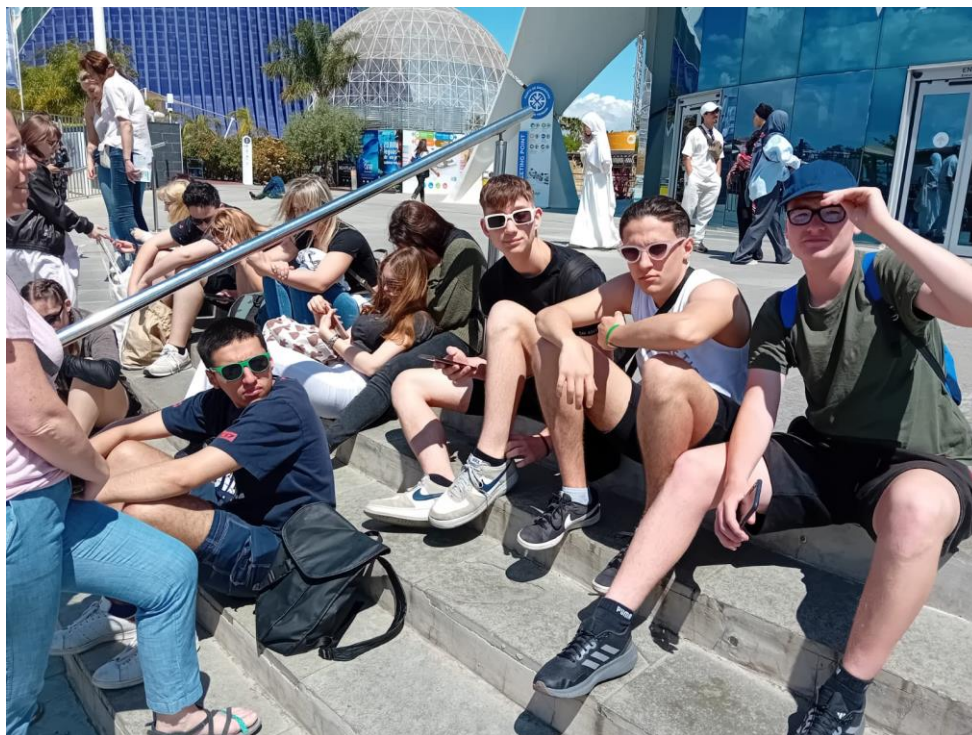
Cserediák program Spanyolországban