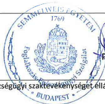
munkaegészségügyi szaktevékenységet ellátó