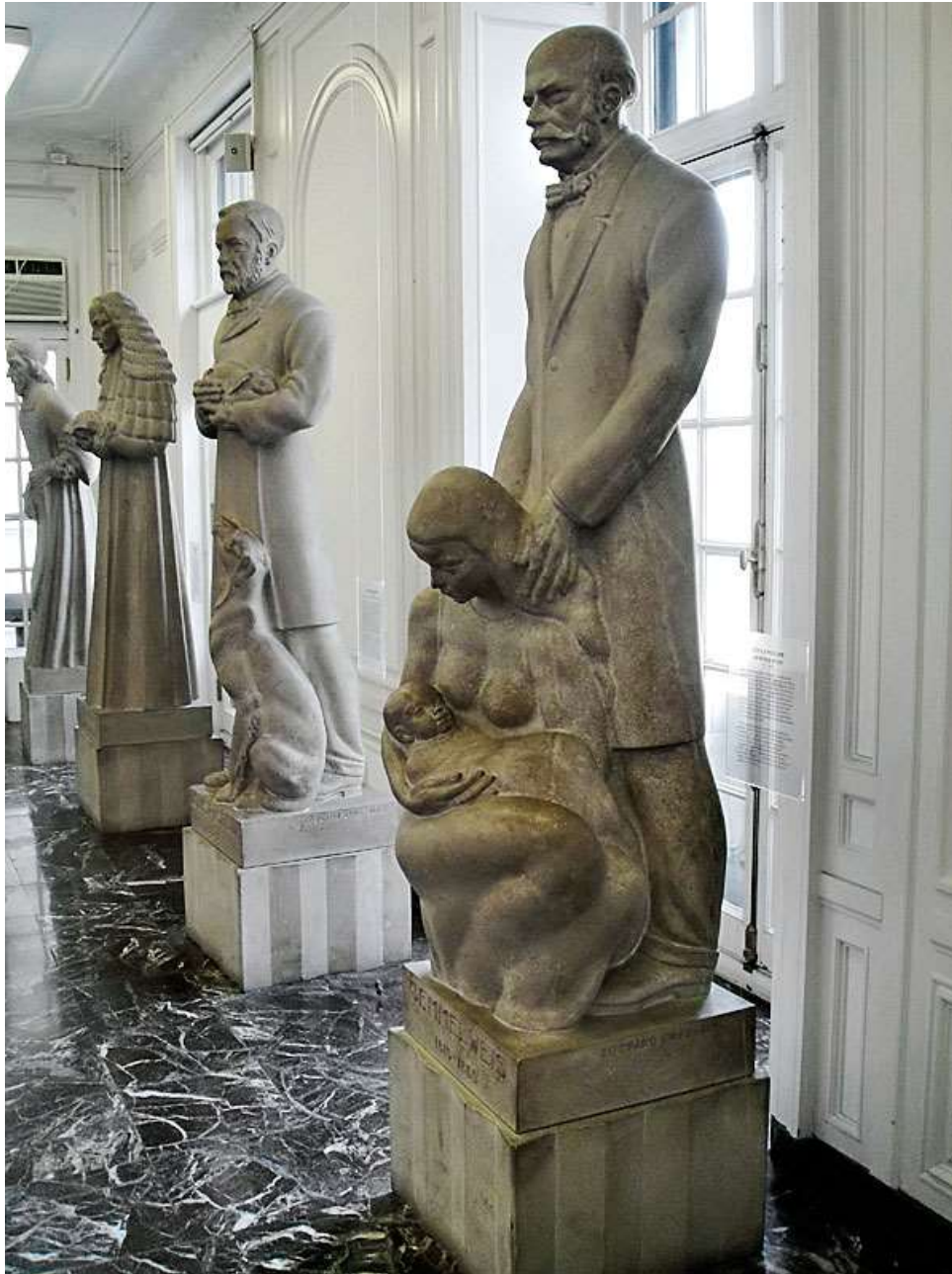
Semmelweis szobra Chicagóban a Sebészeti Múzeumban