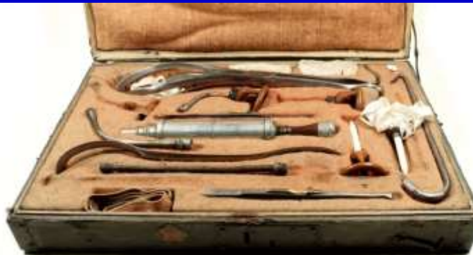
Szülészeti készlet Semmelweis idejéből