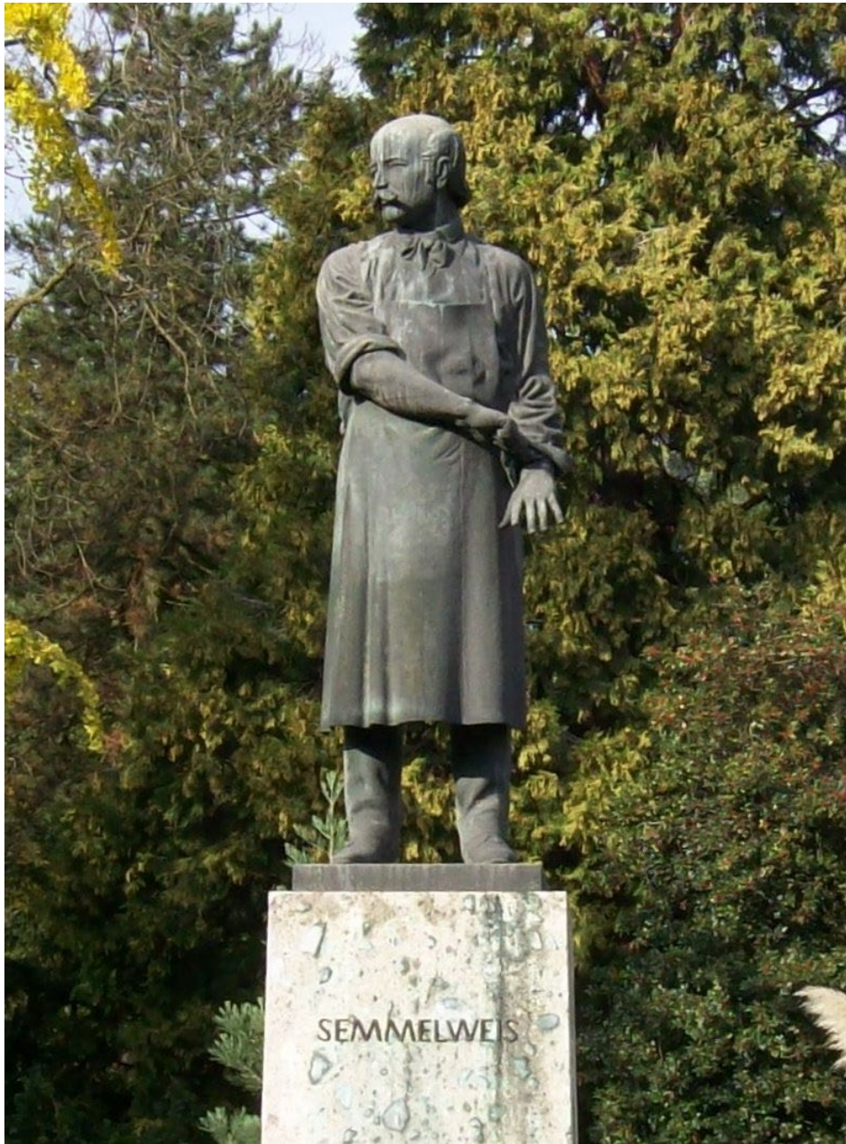
Semmelweis Ignác szobra Heidelbergben