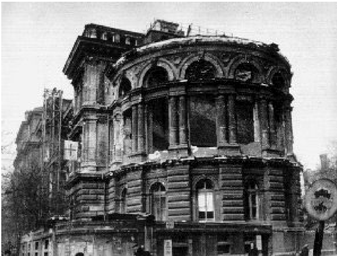
A BOTE Bőrklinika 1956 novemberében