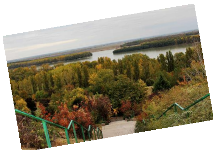
A festői szépségű Duna-part, szoborparkkal

Amennyiben azonban Dunaújvárosban kívánja eltölteni szabadidejét, lehetősége nyílik kulturális intézményekben, sportlétesítményekben, szórakozóhelyeken kikapcsolódni, különböző programokon részt venni, melyek közül ízelítőül itt található néhány: