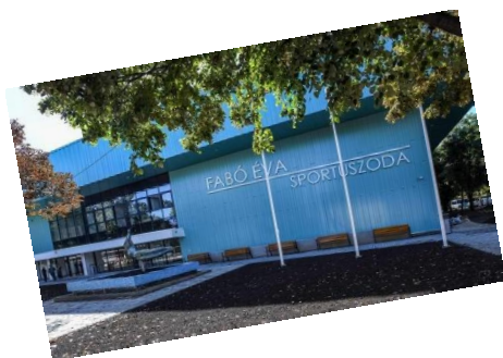
Fabó Éva Sportuszoda