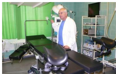
Urológiai endoszkópos műtő

Külön kiemelendő az ortopédiai nagyízületi protézis műtétek, a szemészet szinte teljes spektrumát lefedő, szemlencse, hátsó szegment és retinasebészetet, vitrectomiát is magában foglaló műtétek, az urológia kiterjedt endoszkópos műtétei, a nőgyógyászati osztály radikális onkológiai műtétei, a plasztikai sebészet . Magas szintű a laparoscopiás tevékenység a sebészetben, nőgyógyászatban . A fül-orr-gégészeti osztályon kiemelendő a fej-, nyak- és parotis sebészet. A kórház megyei szintű intenzív, szemészeti és infektológiai osztályt működtet.