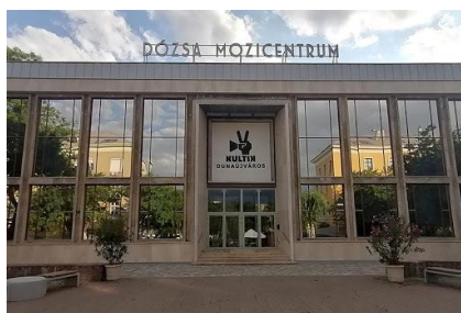
Dózsa Mozi Centrum