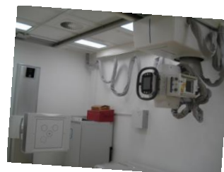
Direkt digitális mellkas felvételi rtg.

Külön kiemelendő az ortopédiai nagyízületi protézis műtétek, a szemészet szinte teljes spektrumát lefedő, szemlencse, hátsó szegment és retinasebészetet, vitrectomiát is magában foglaló műtétek, az urológia kiterjedt endoszkópos műtétei, a nőgyógyászati osztály radikális onkológiai műtétei, a plasztikai sebészet . Magas szintű a laparoscopiás tevékenység a sebészetben, nőgyógyászatban . A fül-orr-gégészeti osztályon kiemelendő a fej-, nyak- és parotis sebészet. A kórház megyei szintű intenzív, szemészeti és infektológiai osztályt működtet.