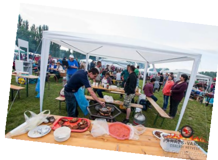
Parázs-Varázs Családi Hétfége a Duna-parton