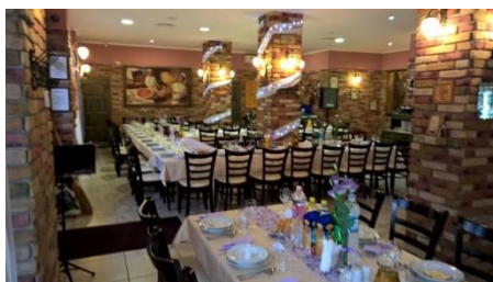
Éttermek, pizzériák, kávézók