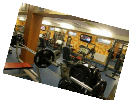
Edzőtermek, bowling pályák