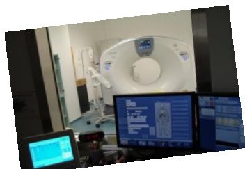
128 szeletes CT

Többfunkciós közösségi kórházként kiterjedt diagnosztikai tevékenységet végez (128 szeletes CT, digitális röntgen és egyéb képalkotó, ultrahang, labor, szövettan) és sokszínű terápiás lehetőséggel is él.