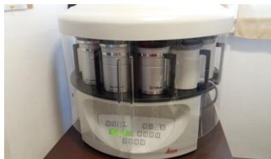
Szövet víztelenítő automata