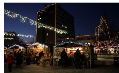
Városháza téri Adventi Forгатag