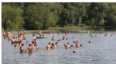
Szalki-sziget Szabadstrand és Camping