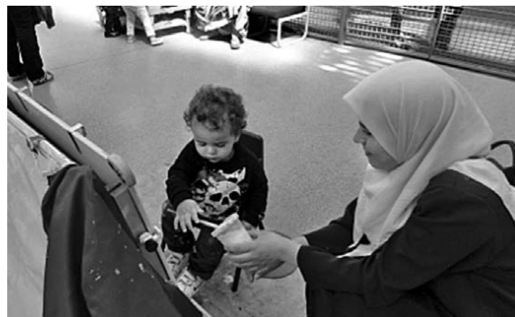
"... azt keressük a másikban, ami összeköt, nem pedig azt, ami elválaszt"

migráns, bevándorló kifejezést, kizárólag szegény vagy hátrányokkal küzdő családokról beszélnek. Az integráció és esélyteremtés legfontosabb intézményei.