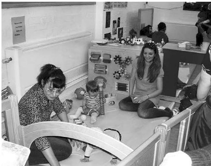
Munkájuk fontos része a szülők bevonása, tájékoztatása és velük való közös munka