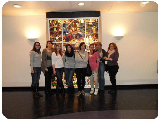
Fogászok az MCL-ben

Bepillantást nyerhettünk a leeuwardeni MCL kórház mindennapjaiba is. Ez egy hatalmas kórház, láttam olyan dolgozót, aki biciklivel közlekedett az intézményen belül. Megnézhettük a fogászati osztályt, és ami mindenkinek a legjobban tetszett a gyermekosztályt. Még aznap délután egy nagyon kedves idegenvezető bácsival végig jártuk