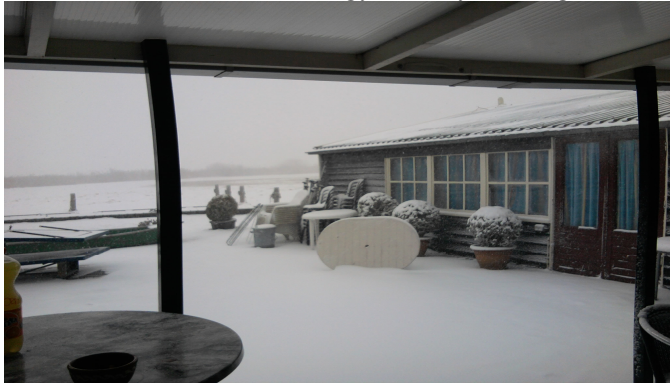
Het Toppunt – 4 hétig az otthonunk

2010. november 6-án érkeztünk meg először Amsterdamba, majd onnan vittek minket Sneekbe, ami Észak-Hollandiában, Fríziában van. Itt volt a szállásunk, Het Toppunt, mely közvetlenül a víz mellett volt egy öbölben. Hihetetlen érzés volt, amikor reggel kinéztem az ablakon és láttam a hajókat pár méterre tőlem siklani a vízen. Volt egy társalkodó helységünk ahol nagyon sok időt töltöttünk. Itt volt internet, így mindenki tudta tartani a kapcsolatot a családjával. Saját konyhánk volt, melynek a felszereltsége egész jó volt, így tudtunk minden nap meleg ételt enni, ha főztünk magunknak. A szobáink 4-5-6 személyesek voltak, de azt hiszem ez senkit nem zavart mivel annyira összekovácsolódott a társaság, hogy inkább élveztük mintsem hogy hátrányként fogtuk volna fel.