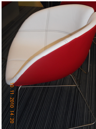
Ez a váró volt.

Hihetetlen „kirándulás” volt. Egész végig csak hüledeztünk és nem hittünk a szemünknek. Hogy miért is nem???? Elég nehéz így elmondani mit is láttunk, de mintha nem is egy kórházban sétálnánk, hanem egy 5 csillagos szállodában. A legmodernebb berendezés, minden gyönyörűen tiszta, a kórház berendezésének és az egyes osztályoknak külön stílusa van, nem pedig csak az a hideg ronda koszos csempe, mint nálunk. A stílus az egyértelműen az ikeás stílusra emlékeztetett a rengeteg színnel.