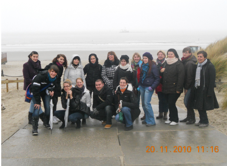
Az egész csapat és háttérben a tenger