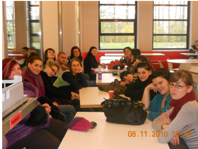
Ezek lennének mi☺ (Az iskola ebédlőjében)