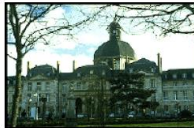
Salpêtrière, Paris (1675)