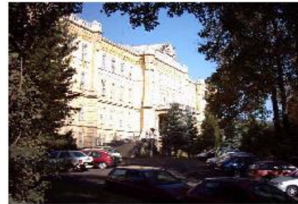
Asylum of Budapest (1886)