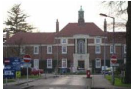
Bethlem Hospital, London (1330)