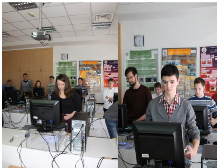
A második forduló eredményei