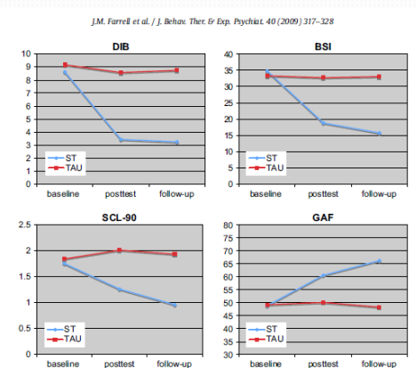
Fig. 2. Means of the outcome measures by group and time.