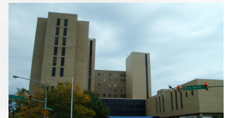
Millard Fillmore G.C. Hospital