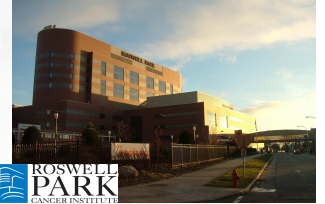
Roswell Park Cancer Institute

Application Form is available on the HMAA website ( www.hmaa.org ) under Exchange Program.