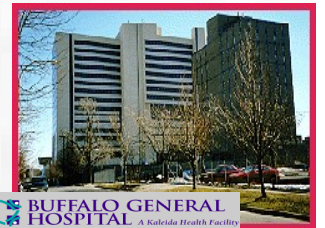
Buffalo General Hospital