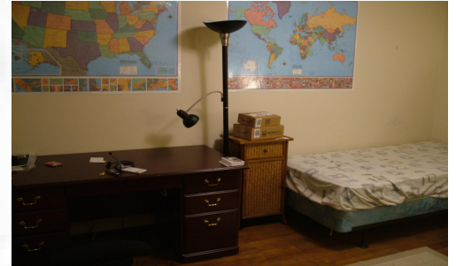
Egyik kétágyas szoba