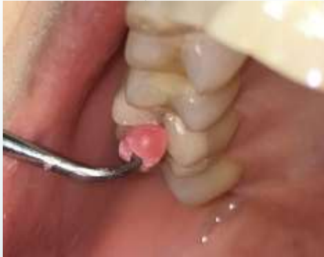
Matrica, ék in situ