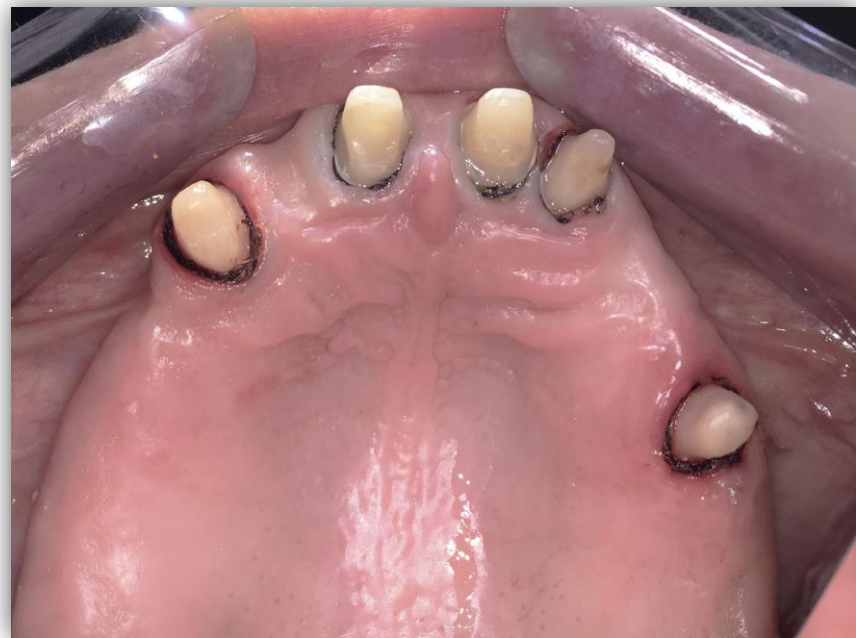
Legömbölyített vállas előkészítés