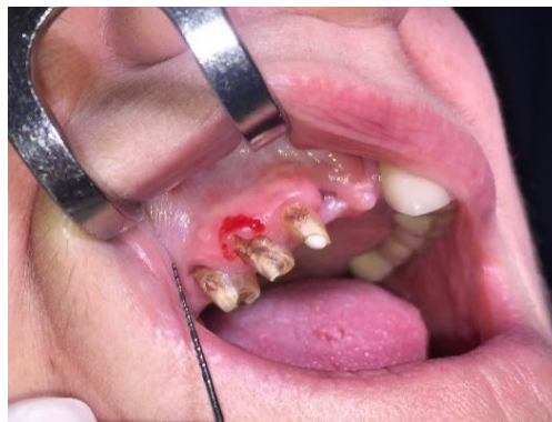
Metszés helyének jelölése.